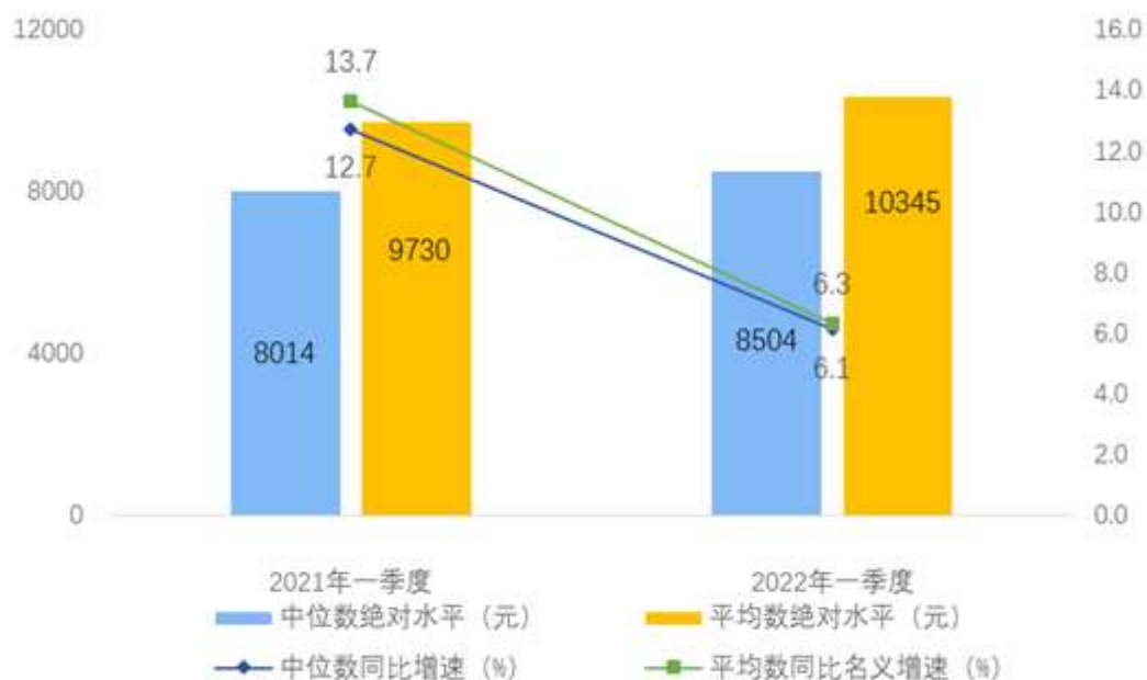
图 1 2022 年一季度居民人均可支配收入平均数与中位数

按收入来源分，一季度，全国居民人均工资性收入 5871 元，增长 6.6%，占可支配收入的比重为 56.8%；人均经营净收入 1733 元，增长 5.4%，占可支配收