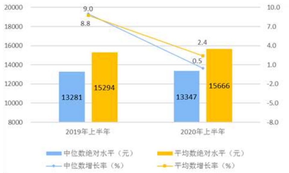
图 1 2020 年上半年居民人均可支配收入平均数与中位数

按收入来源分，上半年，全国居民人均工资性收入 9010 元，增长 2.5%，占可支配收入的比重为 57.5%；人均经营净收入 2341 元，下降 5.1%，占可支配收