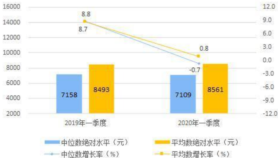
图 1 2020 年一季度居民人均可支配收入平均数与中位

按收入来源分，一季度，全国居民人均工资性收入 4896 元，增长 1.2%，占可支配收入的比重为 57.2%；人均经营净收入 1376 元，下降 7.3%，占可支配收入的比重为 16.1%；人均财产净收入 741 元，增长 2.7%，占可支配收入的比重为 8.7%；人均转移净收入 1548 元，增长 6.8%，占可支配收入的比重为 18.1%。