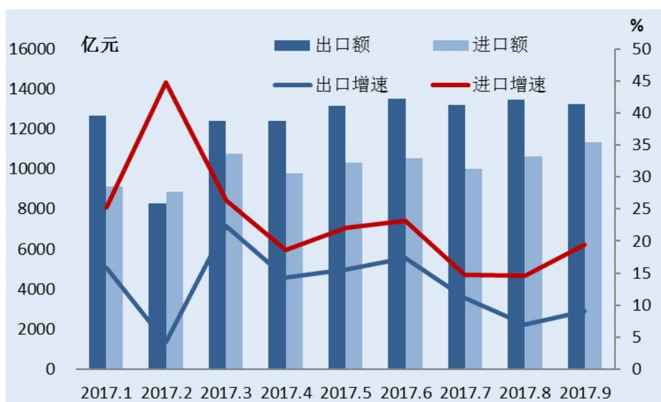
图1 2017年1-9月中国进、出口月度增速（人民币计价）